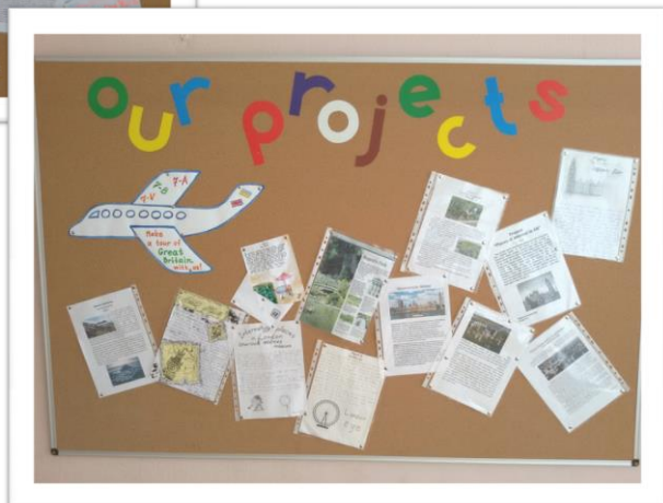
Виставка проектів Тема “A travelling tour to Great Britain” 7 класи