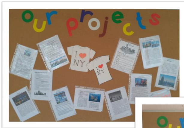
Виставка проектів Тема “The USA. New York” 8 класи